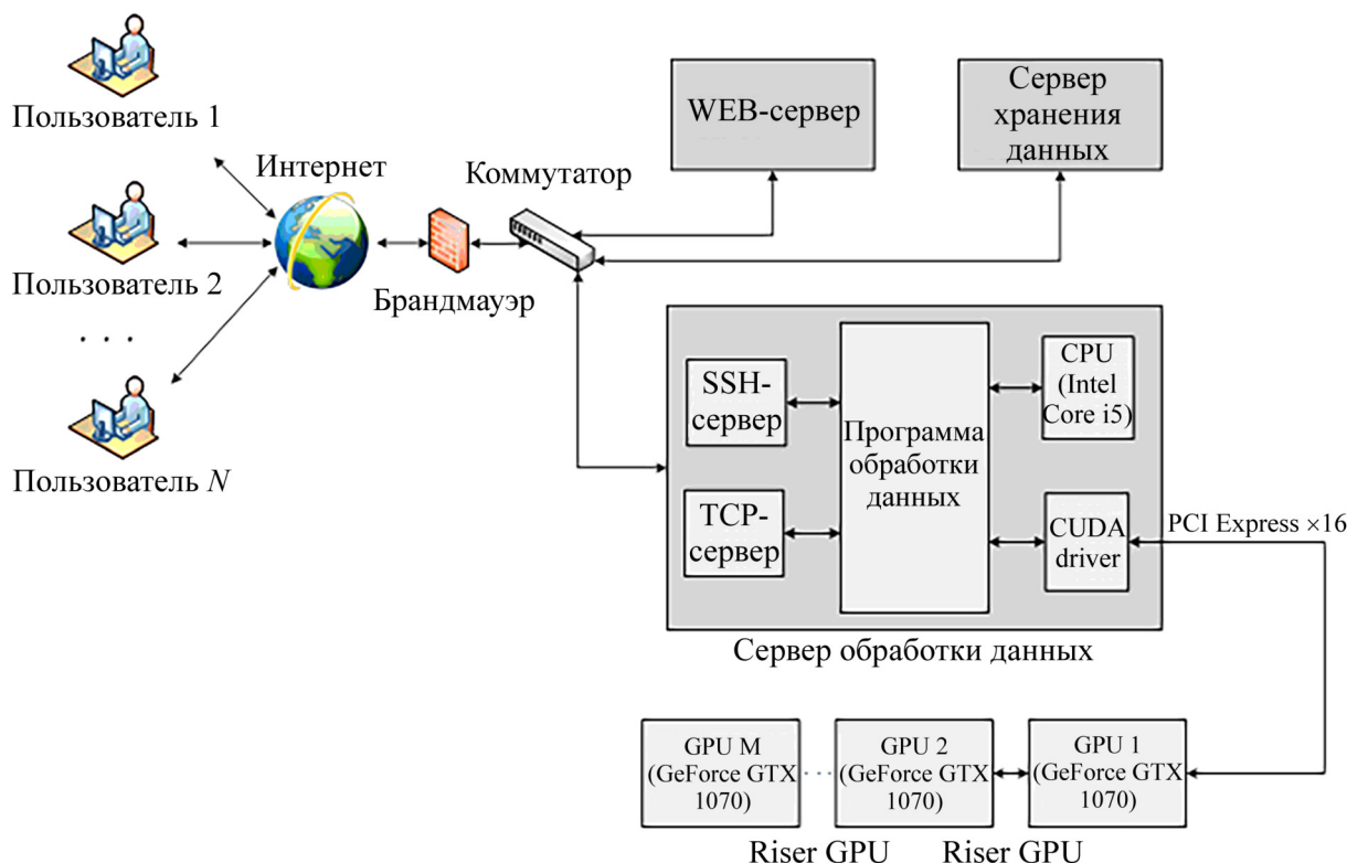
Рис. 1: Структура аппаратно-программного комплекса.

Для программной реализации искусственной нейронной сети и решения поставленной задачи использовалась встраиваемая программная библиотека FANN (Fast Artificial Neural Network), обеспечивающая широкий набор настроек и выбор топологий нейронных сетей [4].